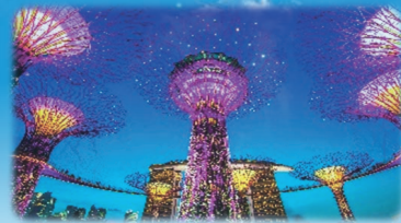
◆ガーデンラプソディの光のショー