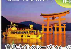
宮島ナイトクルーズ(イメージ)