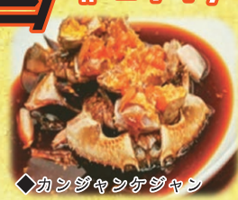
◆カンジヤンケジャン