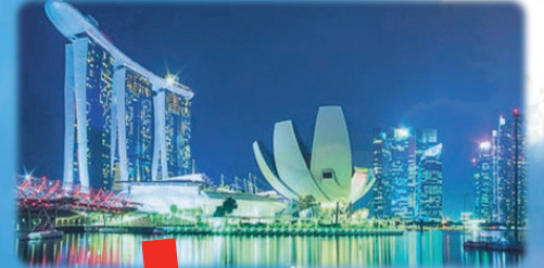
◆マリーナベイサンズ