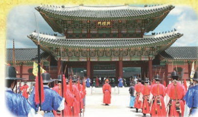
◆景福宮「守門将の交代儀式見学」